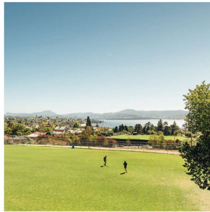
บริเวณโรงเรียนที่มองเห็นแม่น้ำเดอร์เวน

การเลือกโรงเรียนชายมีข้อดีหลายประการ ที่ฮัทชินส์เราจัดเตรียมพื้นที่การเรียนรู้ที่ออกแบบมาโดยเฉพาะสำหรับการสอนเด็กผู้ชาย ซึ่งรวมถึงการจัดหาทรัพยากรและการออกแบบโปรแกรมที่ตอบสนองความต้องการด้านการศึกษาและการพัฒนาของพวกเขา เราจ้างคณาจารย์ที่มีใจรักในการสอนและได้รับการพัฒนาวิชาชีพอย่างต่อเนื่องในด้านการปฏิบัติที่ดีที่สุด การเรียนรู้ที่เป็นนวัตกรรมและสร้างสรรค์